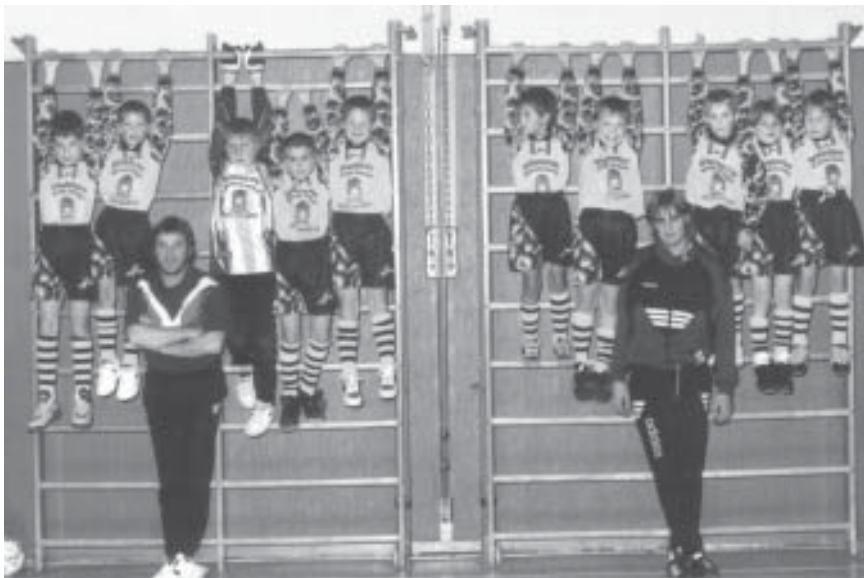
Unsere Spieler haben sich nicht Hängenlassen !!

Am Ende des ersten Spieltages belegte die Mannschaft des Post SV einen undankbaren letzten Platz mit drei mageren Punkten und einem Torverhältnis von 0:2!