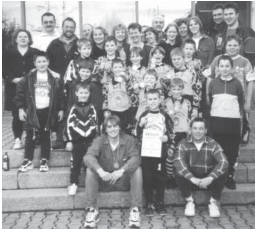
„Der neue Kreismeister 1998/1999 im Hallenfußball“ - mit Anhang

In den Gruppenspielen wurde der stärker eingeschätzte TSV Wemding mit 4:0 der Halle verwiesen. Auch der TSV Fischach (bei der Kreismeisterschaft immerhin 3.) hatte mit 3:0 das Nachsehen. Im TSV Burgau hatten unsere Jungs dann ihren Meister gefunden: Mit 2:4 mußten diesmal wir die Segel strei-