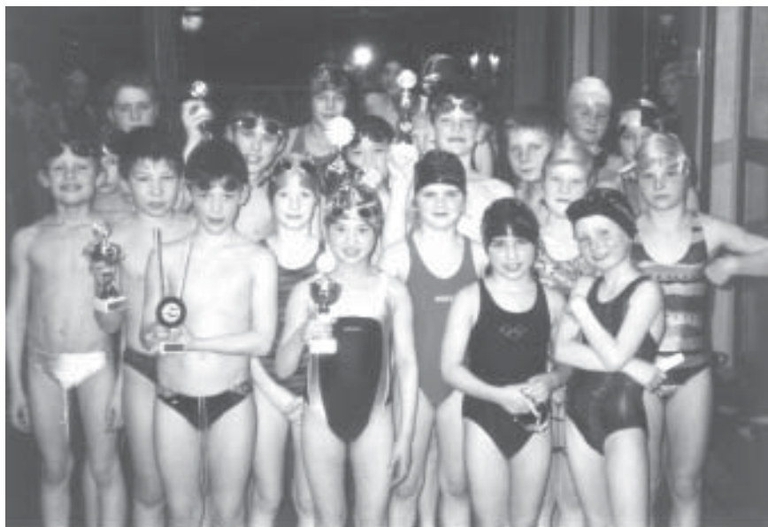
Unsere erfolgreiche Nachwuchs-Wettkampfmannschaft mit 6 erschwommenen Pokalen

Unter der starken Konkurrenz aus München, Erlangen und Würzburg war es nahezu