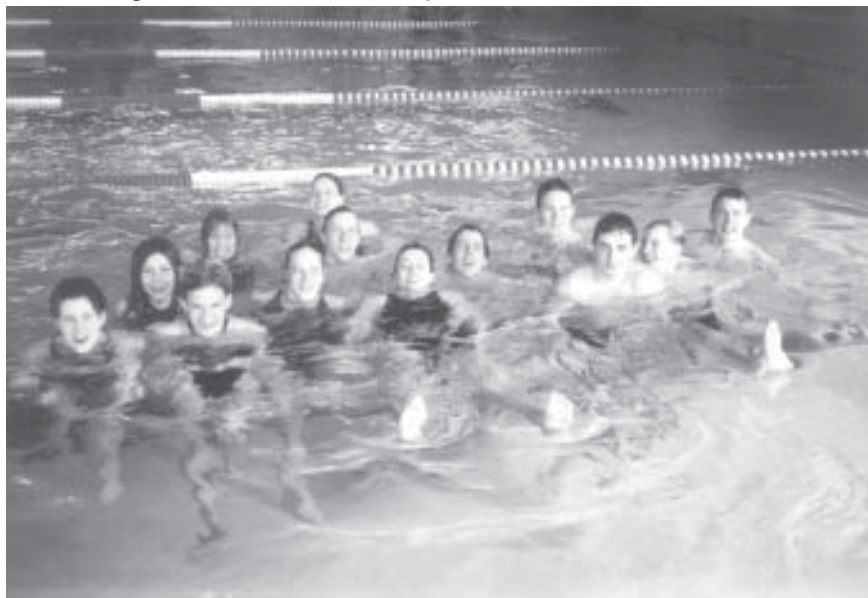
Alle Staffelteilnehmer bei den Bayerischen Staffelmeysterschaften

unmöglich auf einen Medaillenrang zu schwimmen.